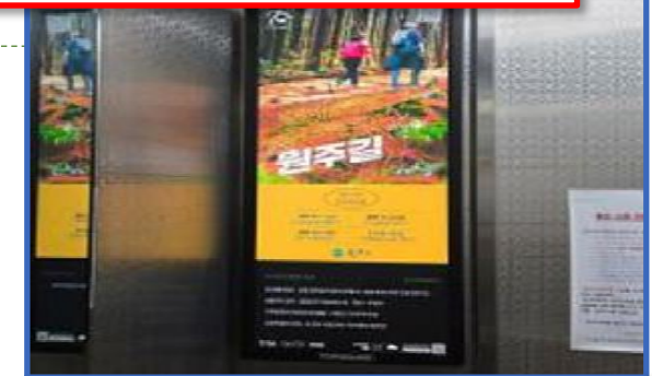
[아파트 디지털 간판]